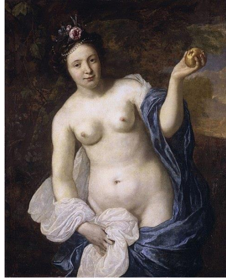
Bron: Van der Helst, Wikipedia