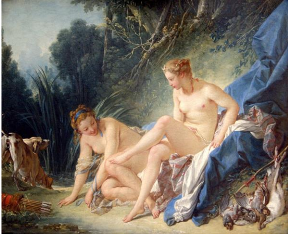
Bron: Boucher, Wikipedia