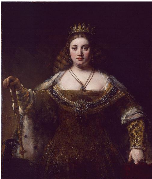
Bron: Rembrandt, Wikipedia